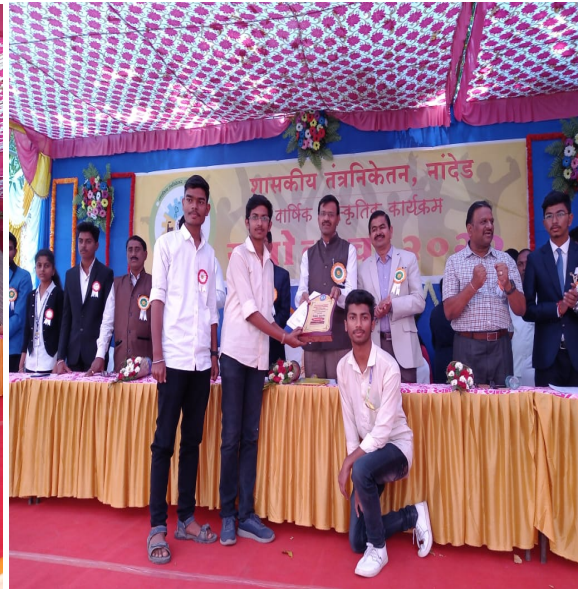
Annual Cultural Programs 27/02/2020 to 28/02/2020