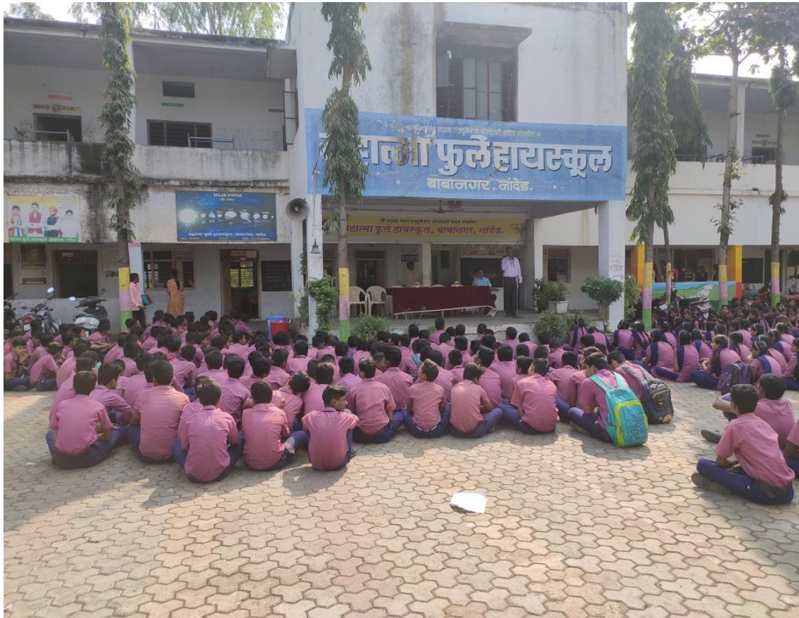
School Connect Program 16/12/2019