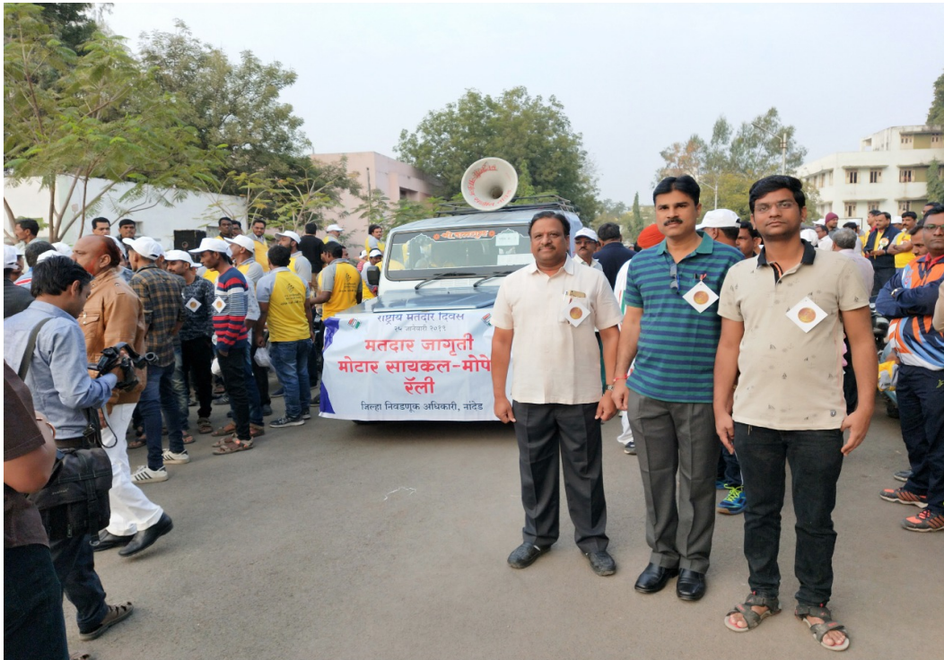
Voters awareness – Motorcycle rally 25/01/2019