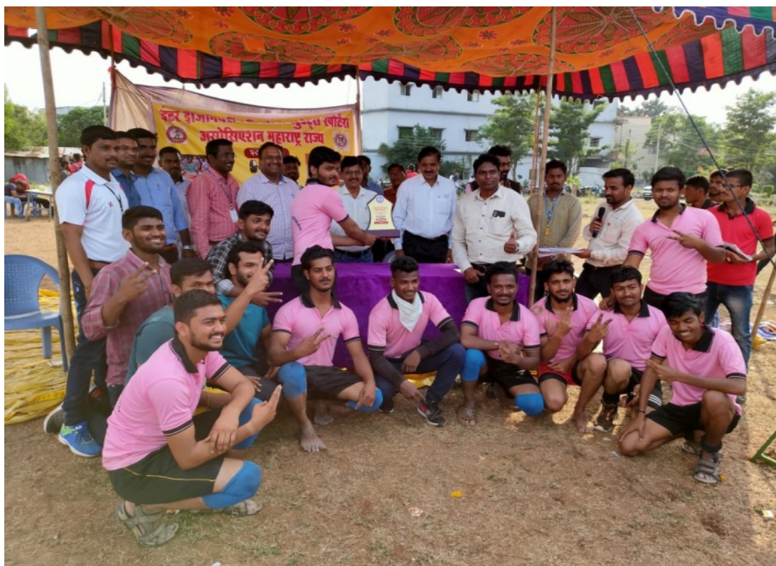
IEDSSA various sport completions 2019-2020