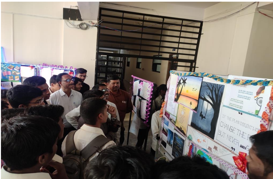
Poster Presentation (Student Corner) 25/02/2020