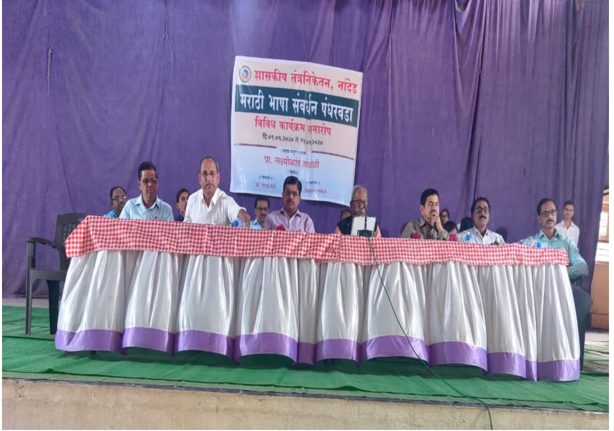
Marathi Bhasha Sanvardhan Pandharwada program 15/01/2020