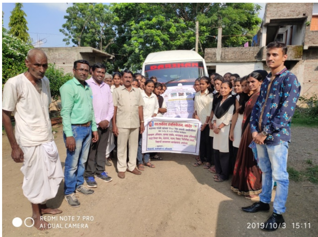
Unnat Bharat Abhiyan 03/10/2019