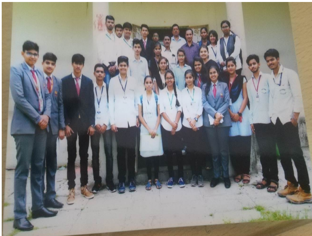
State Level Paper Presentation 23/07/2019