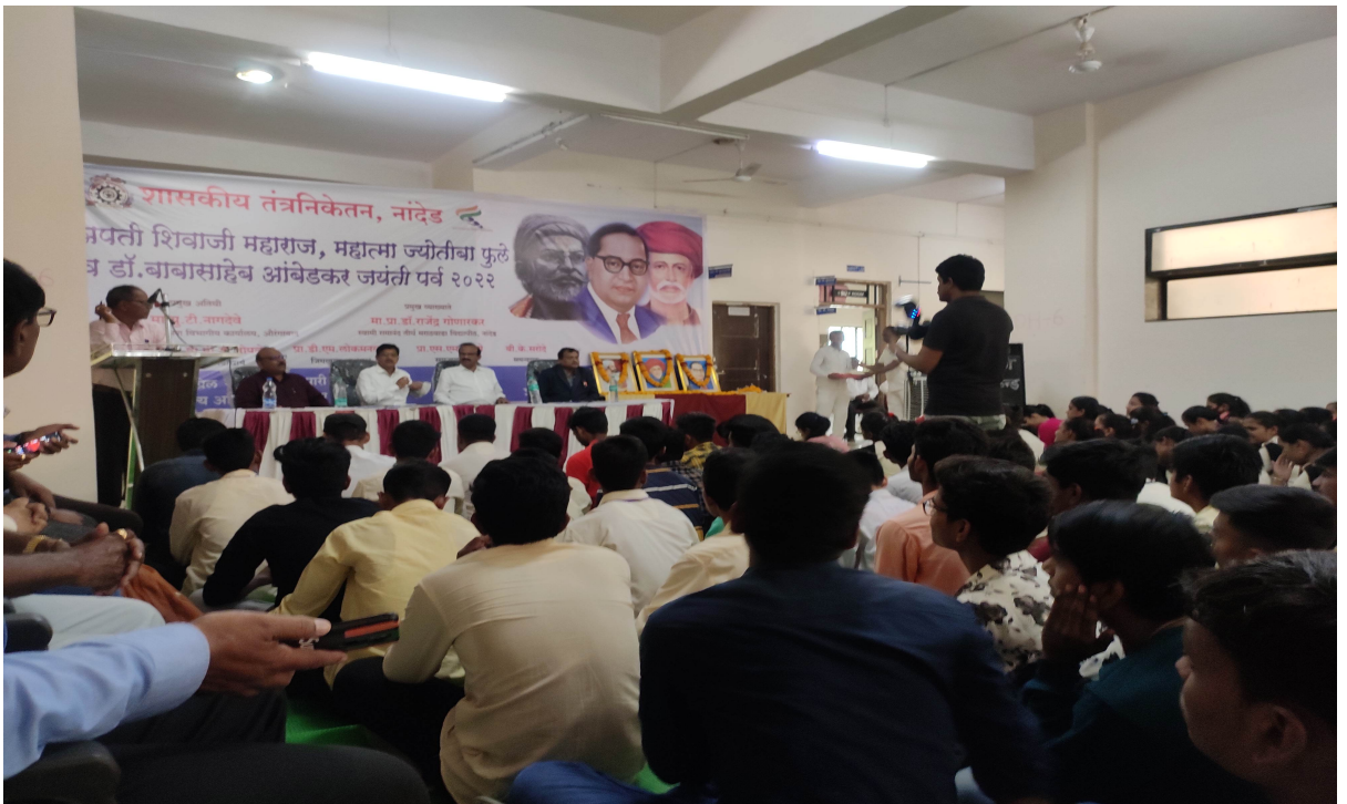
Chatrapati Shivaji Maharaj, Mahatma Jyotiba Phule and Dr. Babasaheb Ambedkar Jayanti Parva 2022 at Civil Eng Dept GP Nanded 30/04/2022