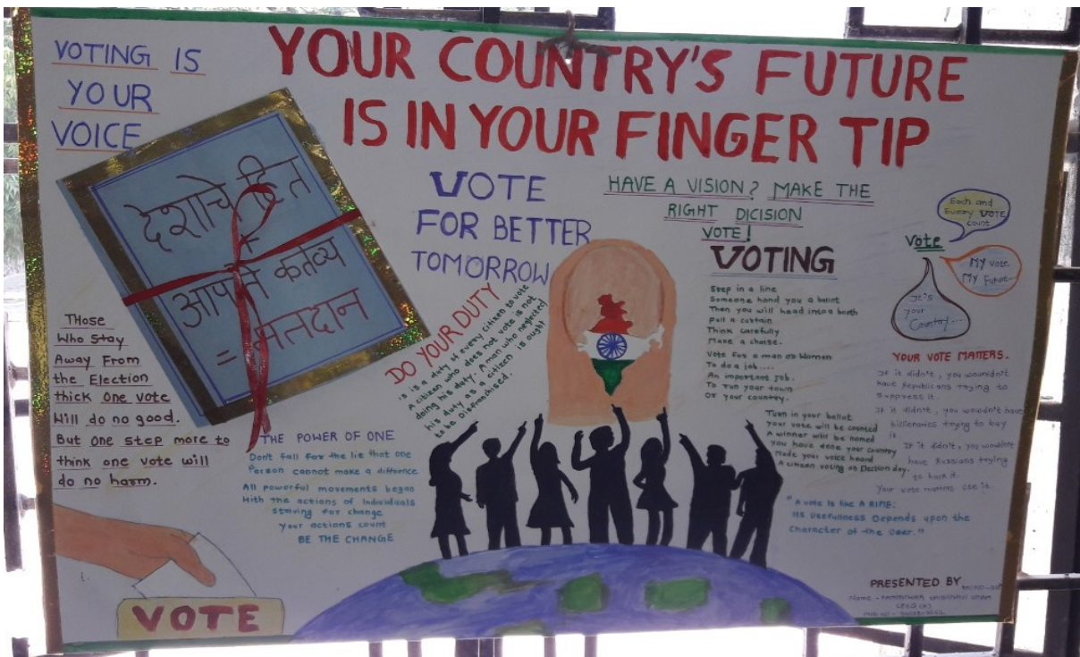
Poster Presentation Event on voters Awareness 25/01/2019