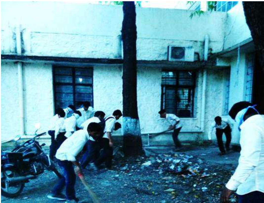
Swachata Abhiyan 01/03/2020