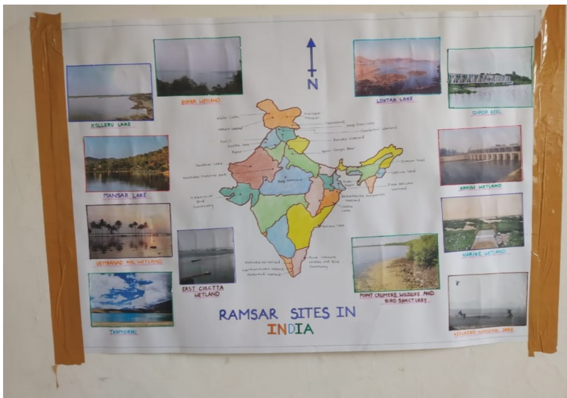
World Wet Land Day Poster Presentation. 15/02/2019