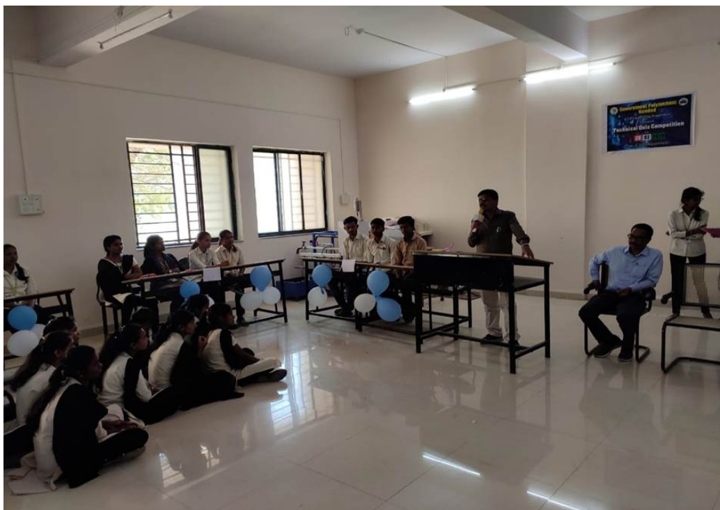
Technical Quiz competition 26/02/2020