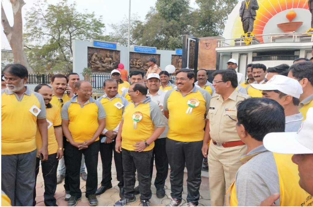
National Voters Day 2019