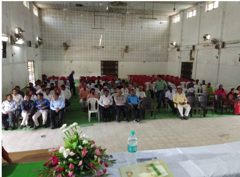
Alumni Meet 16/02/2019