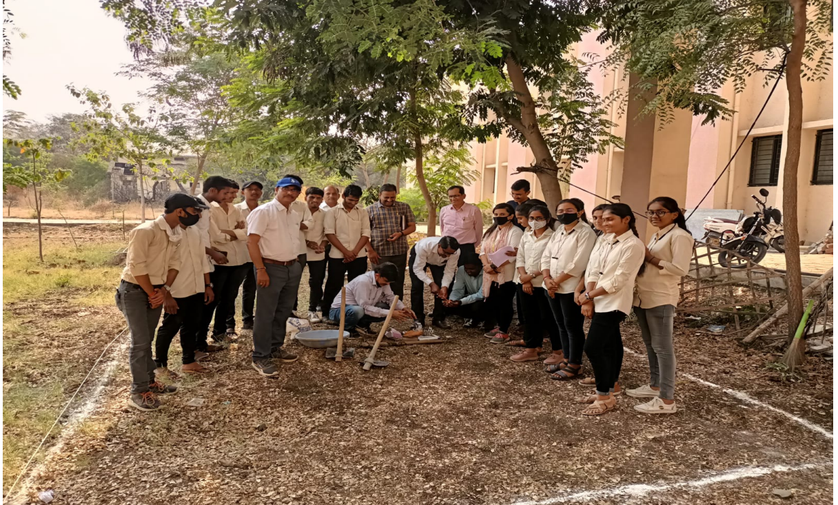
Vermicomposting Live Project at GP Nanded Campus Inauguration 13/04/2022