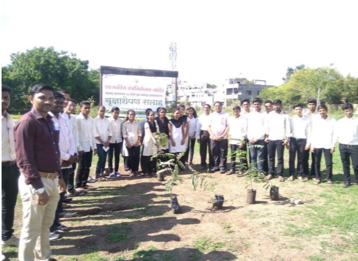
Tree plantation in college campus. 22/07/2019